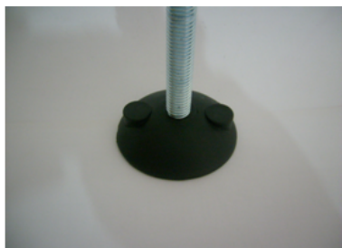
HASTE EM FERRO ZINCADO